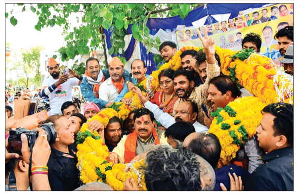
चापड़ा। मुख्यमंत्री का जगह-जगह हुआ स्वागत।