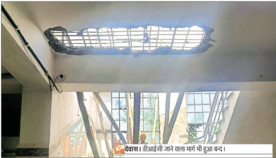
देवास। डीआईसी जाने वाला मार्ग भी हुआ बन्द।